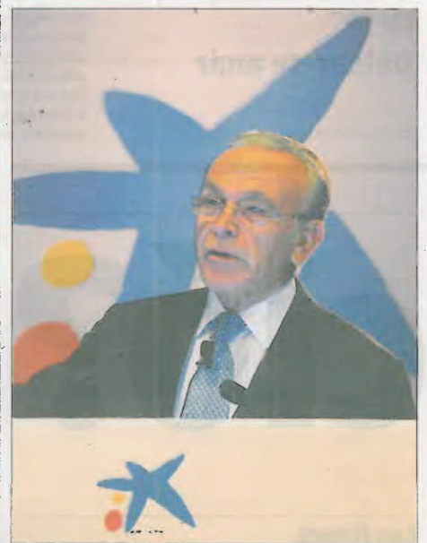
Isidre Fainó, president de Caixa Bank, durant una recent presentació de resultats

D'altra banda, va insistir que la seu de la direcció general de Telecomunicacions i Audiovisual romanirà a Barcelona "perquè així ho diu la llei" i que els seus 122 empleats treballen en "perfecta sincronia" amb la resta de la plantilla de l'organisme regulador, que és a Madrid. ■